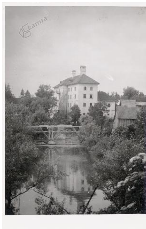
Fotografija 13: Grad Gradac kje je obratovala oficirska šola NOV: Pridobljeno: 17.06.2020, s spletne strani: https://www.kamra.si/digitalne-zbirke/item/gradac.html