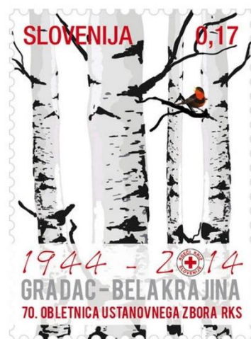
Fotografija 7: Poštna znamka izdana ob 70. obletnici ustanovnega zbora RKS

Med najbolj pomembnimi področji delovanja Rdečega križa Slovenije omenimo krvodajalstvo (že od leta 1953 in po uspešnosti sodi v sam evropski vrh), usposabljanje za prvo pomoč, pomoč ob elementarnih in drugih nesrečah ter iskanje pogrešanih . Rdeči križ opravlja tudi druge nič manj pomembne dejavnosti na področjih logistike, socialne varnosti, zdravstveno-vzgojne dejavnosti, organiziranja brezplačnih letovanj ter širjenju znanj in organizacijski kulturi.