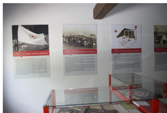
Fotografija 5: Muzej Rdečega križa v Gradcu Pridobljeno 17.06.2020 s spletne strani: https://www.rks.si/sl/Kje_smo/pomaga-ze-70-let/337121