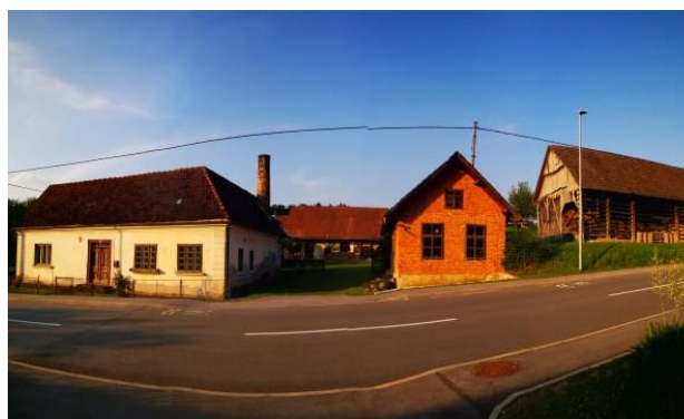
Fotografija 11: Grafova domačija danes, Pridobljeno: 19.06.2020