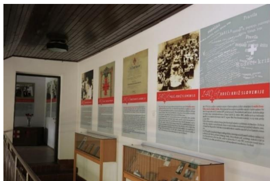
Fotografija 4: Muzej Rdečega križa v Gradcu

1944 - 2014 GRADAC - BELA KRAJINA 70. OBLETNICA USTANOVNEGA ZBORA RKS