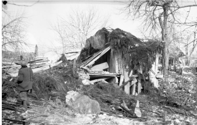
Fotografija 14: Porušena domačija v Gradcu po bombardiranju 30.01.1945