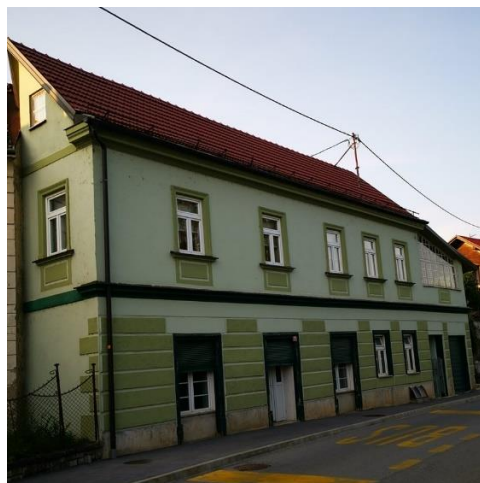
Fotografija 9: Hanzlova hiša v Gradcu danes, Pridobljeno: 19.06.2020