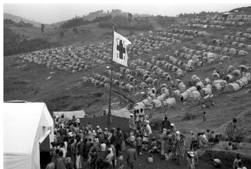
Fotografija 8: Genocid v Ruanci, 1994