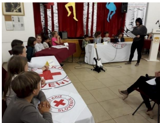
Fotografija 6: Kviz mladih članov Rdečega križa v Gradcu

V organizaciji Rdečega križa Slovenije se v Kulturnem domu Gradac odvijajo različna preventivna zdravniška testiranja in izobraževanja.