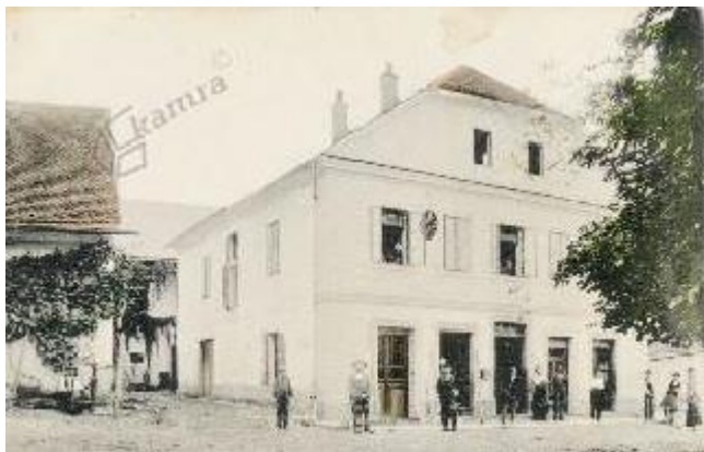
Fotografija 3: Mazelletova hiša - kraj kjer je bil 18. junija 1944 ustanovljen Rdeči križ Slovenije.