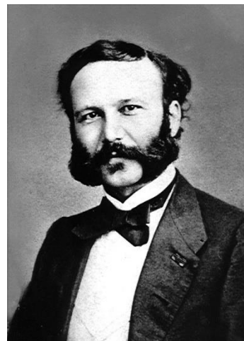
Fotografija 1: Jean Henri Dunant, pridobljeno 17.06.2020 s spletne strani https://sl.wikipedia.org/wiki/Henri_Dunant

Največji preboj pri stalni organiziranosti pomoči in mednarodni zaščiti ranjencev in bolnikov pa se je zgodil 24.6.1859 med bitko pri Solferinu, in sicer je takrat habsburška vojska doživela hud poraz proti združenim vojskam pimonško-sardinskega kraljestva in Francije. V bitki je brez vsakršne pomoči obležalo 40.000 mrtvih in hudo ranjenih vojakov. Na prizorišče boja je med svojim poslovnim potovanjem prišel Ženevčan Henry Dunant. Ko je videl v kakšnih strašnih razmerah so se znašli ranjeni vojaki, je za njih začel organizirati civilno prvo pomoč, ker vojna saniteta takrat ni bila pripravljena na oskrbo takšne množice ranjenih in bolnih ljudi.