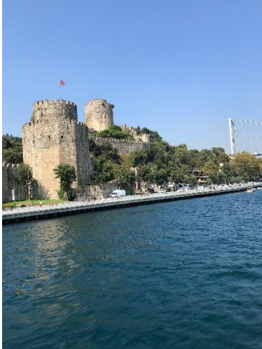
Rumelska trdnjava (2019)

Utrdba, kjer se je vse začelo. Točno tu je Mehmed II. Osvajalec pričel svoj pohod na Konstantinopol.