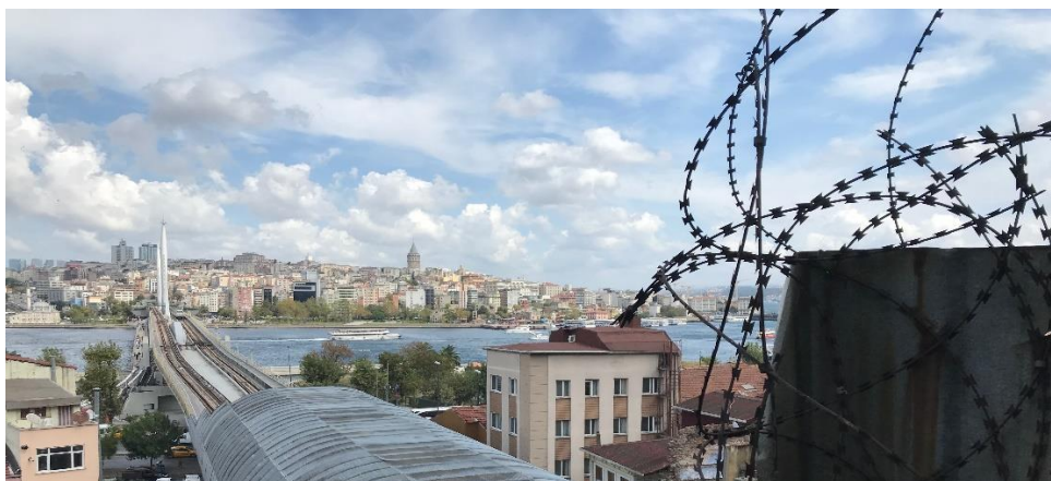
Haličev metro most, ki se razteguje čez Zlati rog (2019)

Pa vendar, upanje umre zadnje. Veliko mesto prinaša velike priložnosti.