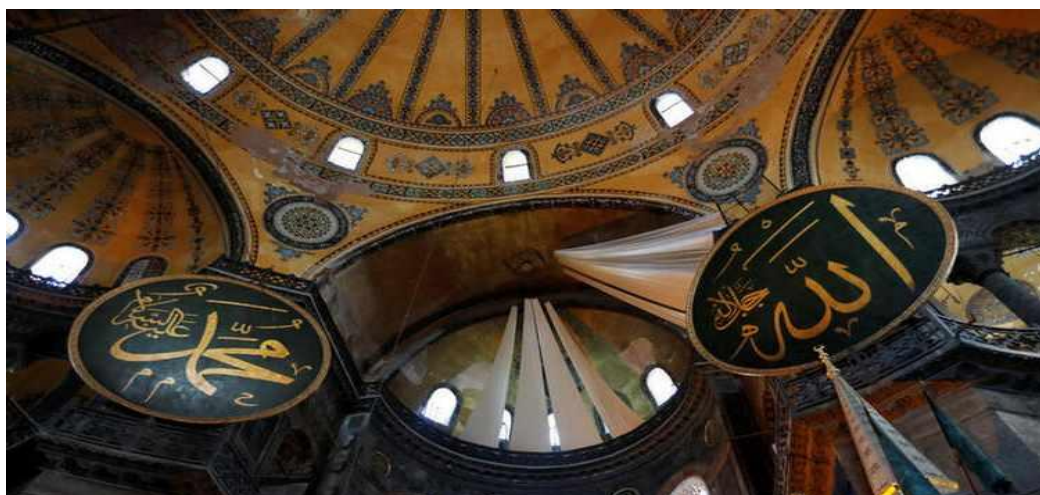
Mozaik Device Marije je zdaj prekrit z belimi zavesami.