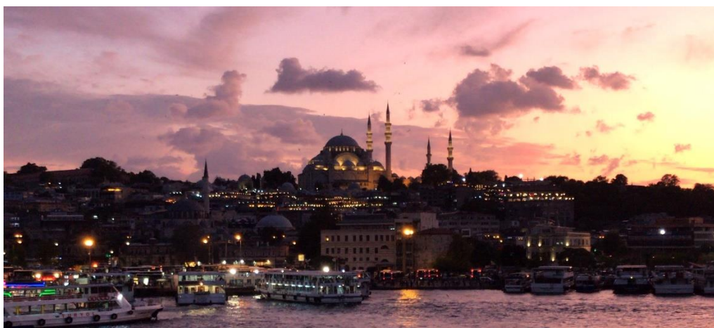
Mošeja Sulejmana Veličastnega z mostu Galata (2019)

Tudi stoletja po prevladi sultanov se točno tu bijejo bitke. A ti ljudje ne obupajo; trdo delajo, z roko v roki, povezujejo kulture in tradicije ter ne dopuščajo režimu, da bi jim zapiral vrata, ki jim jih odpira življenje.