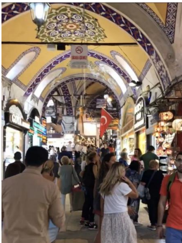
Veliki bazar (2019)

Utrdba, kjer se je vse začelo. Točno tu je Mehmed II. Osvajalec pričel svoj pohod na Konstantinopol.